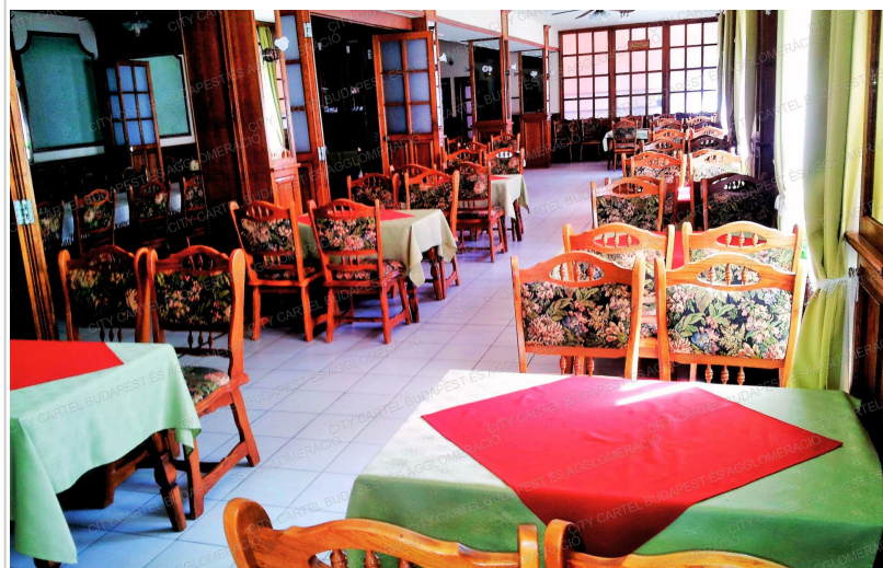
Eladó Szálloda, Panzió